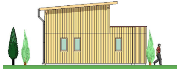
Verbaute Fläche: 32m 2